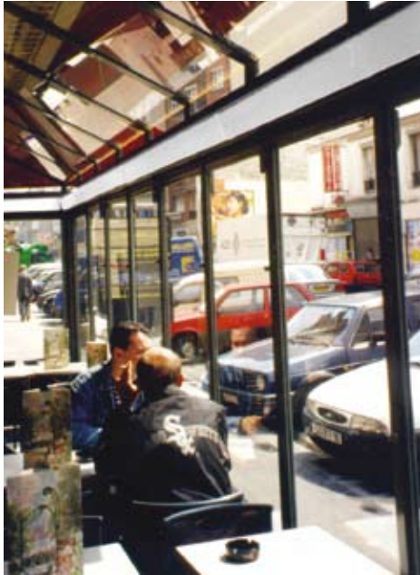
Der direkte Fensterbereich kann effektiv genutzt werden, um kalte Zugluft zu verhindern. Direkt hintereinander montiert bilden hier mehrere Thermoplus eine durchgehende Leiste.