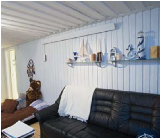
Thermoplus wird direkt im Deckenwinkel montiert und hat dadurch einen minimalen Platzbedarf.