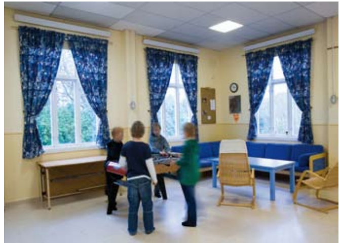
Thermoplus schafft ein angenehm warmes Klima im Raum- und Bodenbereich und ist eine kostengünstige Alternative zu einer Fußbodenheizung.