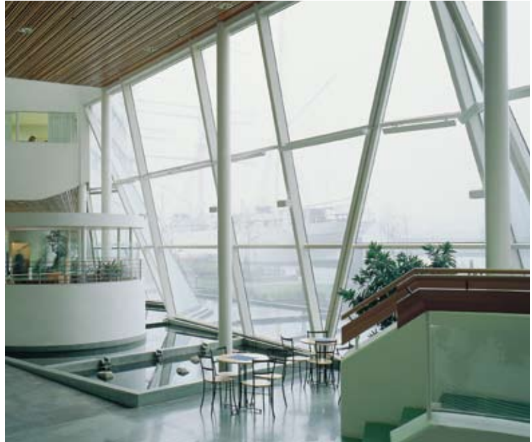
Thermoplus schützt vor kalter Zugluft. Das Wärmestrahlergehäuse wirkt sehr diskret, da es weit oben an einem Träger befestigt ist.