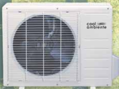
Außengerät GEMS 83H

Das Standardwandgerät GEMS 83H bringt Ihnen kostengünstig reine, natürlich gefilterte Luft in Ihre Räume für ein angenehmes Wohnklima.